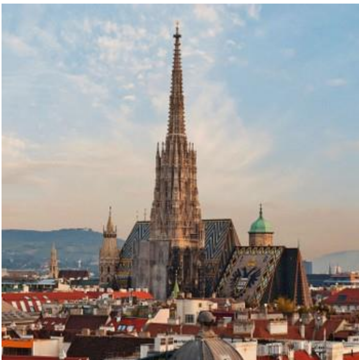
Obr. č. 5 – Chrám sv. Štěpána 10

Po prohlídce zámku se jede autobusem do samého centra Vídně. První zastávkou v srdci Vídně bude nejvýznamnější gotická stavba Rakouska. Tato stavba je symbolem Vídně a nese název Chrám svatého Štěpána. Zde v chrámu se studenti zdrží, jelikož by měli jít na další prohlídku tohoto chrámu a jeho katakomb. Tato prohlídka bude z průvodcem, a to za cenu pro studenty od 14 do 18 let za 3,80 Euro. Zde opět platí s doprovodem zdarma. Tyto ceny byly nalezeny na oficiálních webových stránkách Chrámu sv. Štěpána.