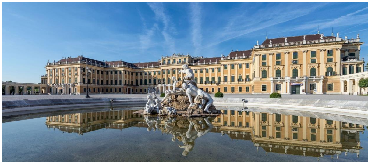
Obr. č. 3 – Zámek Schönbrunn 8

nabídnuta sleva jak pro hromadný vstup, tak pro studenty. Konečná cena pro jednoho studenta byla 9,80 Euro. Tato cena zahrnovala českého průvodce, který by provedl studenty skoro celým zámekem, který je za nejnižší cenu zpřístupněn. Na každých deset studentů má doprovod vstupné zdarma. Dále mají studenti možnost se projít v zahradě u zámku.