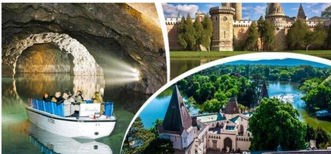
Obr. č. 6 – Vodní zámek Franzesburg 11

A to vodní zámek Franzesburg spojená s plavbou v podzemním jezeře a návštěva čokoládovny. Zde v podzemí byla vybudována továrna na letadla a bylo zde vyrobeno jedno z prvních letadel. Po krátké projížďce v podzemí a prohlídce zámku a jeho okolí se přemístí studenti do čokoládovny. Čokoládovna se nachází kousíček od vodního zámku, těsně s hranicemi se Slovenskem. Zde bude krátká prohlídka čokoládovny s možností nakoupení jejich sortimentu.