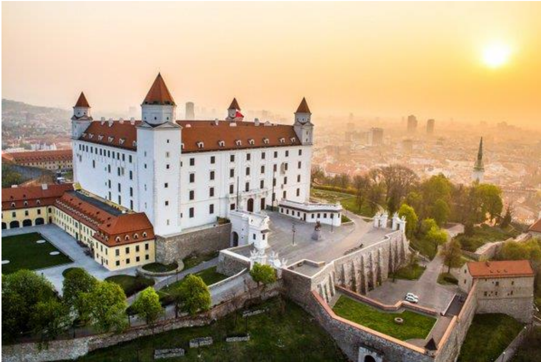
Obr. č. 7 – Bratislavský hrad 12

Následně všechny čeká přejezd autobusem do centra Bratislavy, kde studenty provede průvodce. Průvodce studentům ukáže vyhlídkovou věž UFO, Pomník Slavín, pomník známý pod názvem Čumil a další věci, které jsou známé pro Bratislavu.