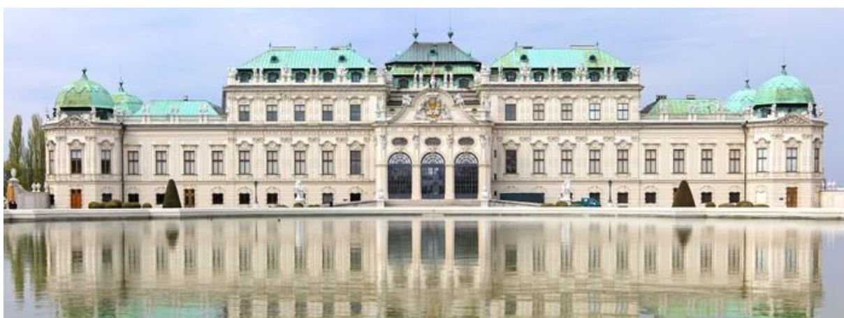
Obr. č. 4 – Zámek Belveder 9

Následovně se všichni autobusem přemístí na další zámek Belveder. Belveder je barokní zámek s nádhernou zahradou. Tento zámek navštíví studenti i uvnitř. Zde v zámku se nachází spousta památek od slavných umělců jako Gustav Klimt, Egon Schiele a další. Tento zámek je přístupný dětem do 19 let zdarma.